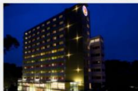
珍珠山瑞丽酒店 Hotel Re! @ Pearl's Hill