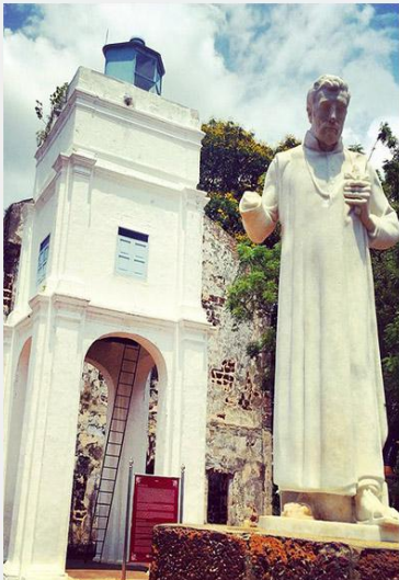
马六甲圣保罗教堂