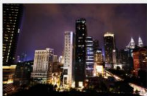
吉隆坡帝盛酒店 Dorsett Kuala Lumpur