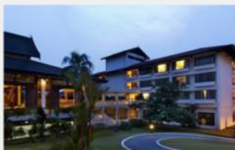
绍嘉纳酒店和度假村 Saujana Hotel & Resorts