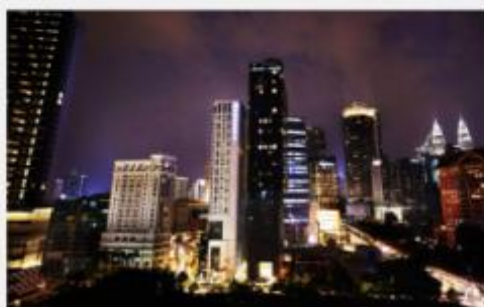
吉隆坡帝盛酒店 Dorsett Kuala Lumpur