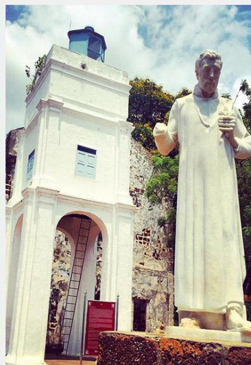
马六甲圣保罗教堂