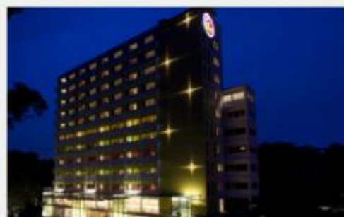
珍珠山瑞丽酒店 Hotel Re! @ Pearl's Hill