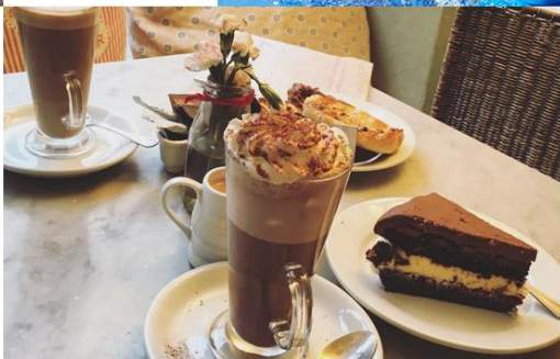
品质下午茶 AFTERNOON TEA