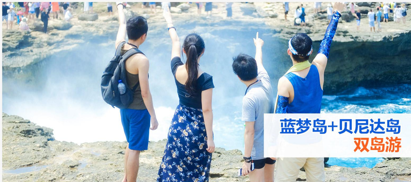
蓝梦岛+贝尼达岛 双岛游