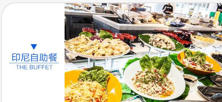
印尼自助餐 THE BUFFET