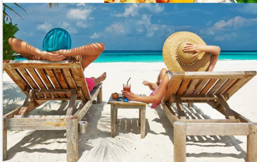
沙滩躺椅 BEACH CHAIR