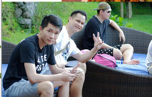
沙滩躺椅 BEACH CHAIR