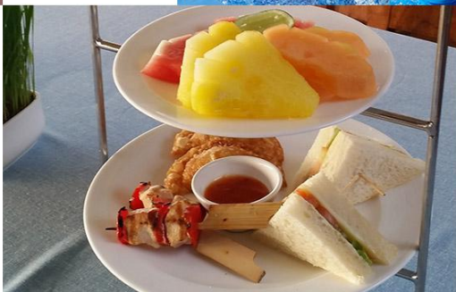
品质下午茶 AFTERNOON TEA