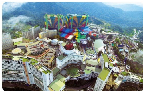
云顶第一世界度假村

声明：酒店是我们精心挑选的适合国人度假旅行的酒店，所有团全部入住以上酒店其中之一，若届时酒店满房，将按照同级调房！当地五星等同于国内四星，绝非精品酒店，请务必收客之前给客人介绍！