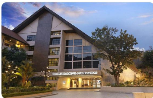
吉隆坡苏邦假日酒店