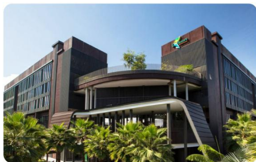
城东乐怡乐怡度假村